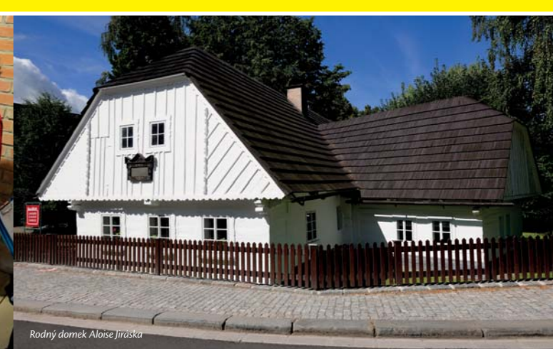
Rodný domek Aloise Jiráska