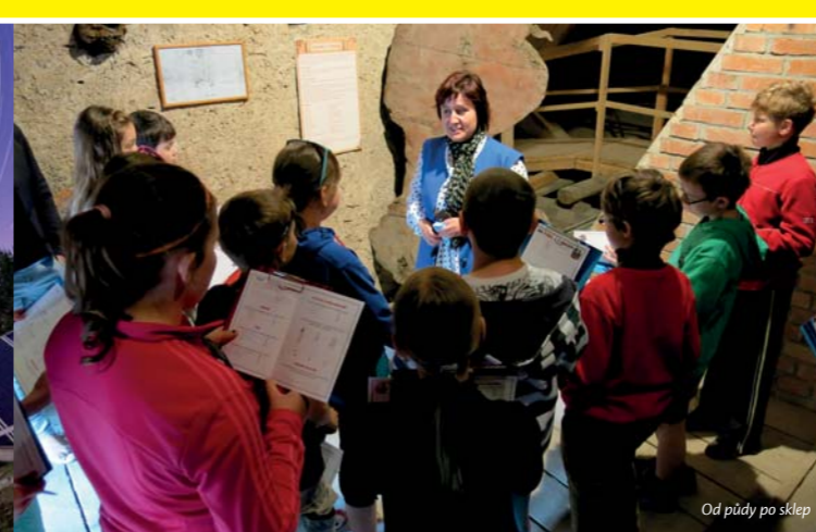
Od půdy po sklep